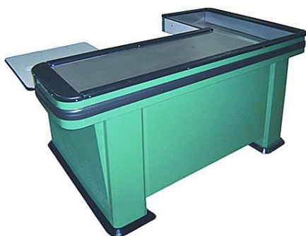
Obr.5 Pokladničný box bez pásu, [6]