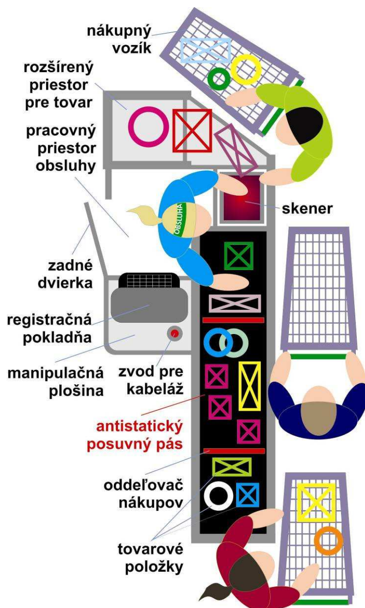
Obr. 7 Usporiadanie a funkčné časti pokladničného boxu

Materiál pásu, resp. aj materiál okolitých pevných častí boxu, je tiež hygienicky vyhovujúci, pretože prichádza do kontaktu s potravinami.