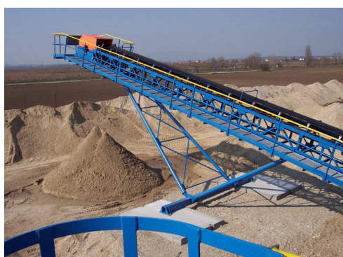
Obr.2 Veľký pásový dopravník na prepravu sypkých hmôt, [3]

Nasledujúce obrázky Obr.2, 3 a 4 sú ilustračnou ukážkou troch principiálne odlišných typov pásových dopravníkov.