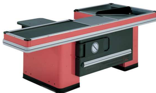
Obr.6 Pokladničný box s pásom, [5]

Mechanické pokladničné boxy s dopravným pásom nachádzajú široké uplatnenie v podmienkach stredne veľkých samoobslužných predajní, ako aj veľkopredajní, s požiadavkami na rýchle vybavenie aj značne intenzívneho toku nakupujúcich.