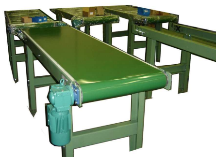
Obr.3 Krátky horizontálny dopravník s PVC pásom, [4]