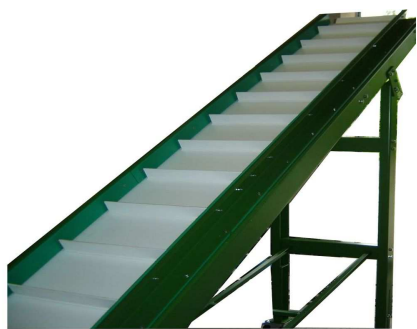
Obr.4 Stúpajúci dopravník s rebrovaným PVC pásom, [4]