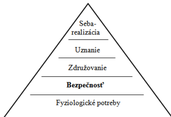
Obr. 1. Pyramída ľudských potrieb podľa A. Maslowa [2]

Potreba istoty a bezpečnosti sa objavuje aj v základných potrebách, definovaných Corellom, ktorý ich definoval takto: