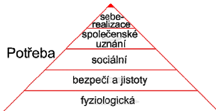
Obr. 2. Maslowova pyramida lidských potřeb; zpracováno dle [8].

Podívali-li se na dnešní diskuse ve všech sférách, které byly zmíněny v úvodu, tak je skutečností odpověď, že řada výše uvedených aspektů se neřeší.