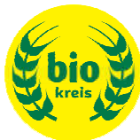
Obr. 8 Značenie Bio Kreis 21