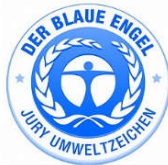
Obr. 1 Environmentálna značka typ I Modrý anjel - Der blaue Engel 5

Modrý anjel podporuje záležitosti týkajúce sa ochrany životného prostredia a ochrany spotrebiteľa. Preto sa udeľuje produktom (výrobkom alebo službám), ktoré sú mimoriadne prospešné pre životné prostredie pri všestrannom zvažovaní a ktoré tiež spĺňajú vysoké štandardy bezpečnosti a vhodnosti na použitie pri práci. 4