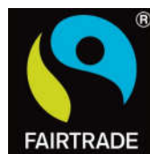
Obr. 19 Logo Fairtrade 49

FAIRTRADE je etický obchodný systém, ktorý kladie ľudí na prvé miesto. FAIRTRADE ponúka poľnohospodárom a pracovníkom v rozvojových krajinách lepšiu dohodu a príležitosť zlepšiť svoj život a investovať do svojej budúcnosti. FAIRTRADE poskytuje spotrebiteľom príležitosť pomôcť znížiť chudobu a podnieť zmeny prostredníctvom každodenného nakupovania. Keď výrobok nesie certifikačnú značku FAIRTRADE, znamená to, že výrobcovia a obchodníci splnili normy FAIRTRADE. Štandardy FAIRTRADE zahŕňajú sociálne, environmentálne a ekonomické kritériá, ako aj požiadavky na pokrok a podmienky obchodu. Štandardy sú určené na podporu trvalo udržateľného rozvoja malých výrobcov a pracovníkov v poľnohospodárstve v najchudobnejších krajinách sveta. Fairtrade International je združením 25 organizácií na celom svete vrátane národných iniciatív, ktoré propagujú a udeľujú licenciu značke FAIRTRADE a výrobným sieťam, ktoré reprezentujú producentov na najvyššej úrovni rozhodovania v medzinárodnom systéme FAIRTRADE. 48