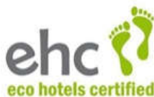
Obr. 16 Značenie EHC Eco hotel certified 43

Táto certifikácia znamená väčšiu environmentálnu vhodnosť, vyššiu udržateľnosť a väčšiu regionálnu úroveň v podnikaní. Ide o certifikáciu trvalo udržateľných podnikov v oblasti cestovného ruchu a zohľadňuje ich celkové využívanie zdrojov. Údaje o CO 2 sa zhromažďujú a vyhodnocujú v porovnaní s podobnými podnikmi pomocou anonymného porovnávacieho systému a to znamená, že sa dajú porovnať s najlepšimi v konkrétnom segmente/kategórii (triede). Toto hodnotenie tiež určuje, kde je možné vykonať konkrétne zlepšenia. Tento prebiehajúci benchmarkový systém hodnotenia zabezpečuje, že zúčastnené podniky sa neustále zlepšujú, pokiaľ ide o využívanie zdrojov a udržateľnosť prevádzky. 42