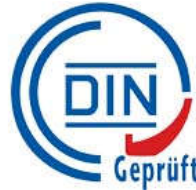
Obr. 13 Značenie DIN Geprüft. 33