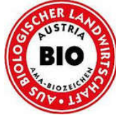
Obr.5 ZnačenieAMA Biozeichen 15

Značenie AMA Biozeichen založená Ministerstvom poľnohospodárstva ako jedinečná značka pre rôzne združenia výrobcov biopotravín je určená len pre potraviny vyrobené ekologickým poľnohospodárstvom. Existujú dve verzie štítka, jedno bez určenia pôvodu (čierny štítok) a jeden so špecifikáciou pôvodu (červený štítok). 14