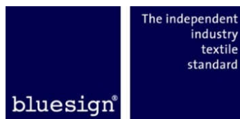
Obr.10 Bluesign® standard logo. 25

Štandard Bluesign® spája celý reťazec výroby textilu, aby spoločne znížil ekologickú stopu zodpovedne pôsobiaceho textilného priemyslu. Namiesto zamerať sa na testovanie hotových výrobkov analyzuje štandard Bluesign® všetky vstupné toky - od surovín po chemické komponenty až po zdroje - so sofistikovaným procesom "Input Stream Management". Pred výrobou sa komponenty posudzujú na základe ich ekotoxikologického vplyvu. Potenciálne škodlivé látky preto môžu byť odstránené ešte pred začiatkom výroby. Kľúčovým aspektom normy Bluesign® nie je kompromis o funkčnosti, kvalite alebo dizajne produktu. Použitím "najlepšej dostupnej technológie" (BAT) v celom textilnom výrobnom reťazci sa zabezpečuje, že výrobky spĺňajú environmentálne normy bez toho, aby obmedzili výkonnostné požiadavky. 24