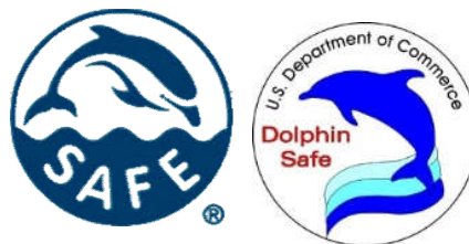
Obr. 14 Značenia Dolphin safe 36,37

Jedinečný medzinárodný monitorovací program Earth Island má osemnásť zamestnancov v siedmich krajinách po celom svete, ktorí pravidelne kontrolujú tuniaky v zásobníkoch, na prístavoch a na palube rybárskych plavidiel, aby poistencov uistili, že tuniak, ktorý kupujú, je skutočne "bezpečný pre delfíny". Ide o najväčší súkromný program na monitorovanie životného prostredia na svete. Udržujú dohody s viac ako 500 spoločnosťami na lov tuniakov po celom svete, vrátane všetkých významných spracovateľov tuniakov. 35