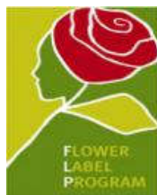
Obr. 20 Značenie Flower Label Program 51

Program FLP (Label Flower) je združenie organizácií pre ľudské práva, odbory, obchodníkov s kvetmi a výrobcov. Zaručuje sociálne a environmentálne zodpovedné a vhodné podmienky pri celosvetovej výrobe kvetov pomocou nástroja certifikácie. Výrobcovia, ktorí vyrábajú podľa kritérií normy FLP, môžu predávať svoje kvety s takzvaným "kvetinovým štítkom". Tento produkt sa predáva ako pridaná hodnota výrobku. 50