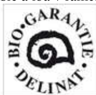
Obr. 12 Značenie Delinat Bio Garantie 30

Použitie medi je obmedzené na 4 kg na hektár za rok. Cieľom je nahradiť ich alternatívami a použiť odrody tolerantné voči hubám. Síra sa môže používať len v nízkych koncentráciách. Každé víno musí prejsť chuťovou skúškou degustačnej komisie a iba v rámci miestnych (európskych) vín. 29