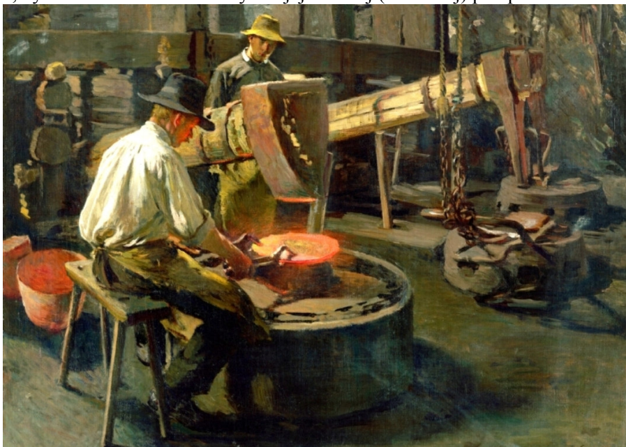
Výrez obrazu Dominika Skuteckého Vykúvanie kotlov (SNG) použitý na euro-suvenírovej bankovke

Omnoho dôležitejšie je však posolstvo poučení z príbehu Turzovcov. Spočíva v úspešnom dvestoročnom pokračovaní tohto rodu, pôvodne spišských kopijníkov, a je vyjadrené odkazom príkladu Turzovsko-fuggerovského podnikania pre dodržiavanie základných princípov Európskej únie: sloboda pohybu osôb, kapitálu a služieb, rovnosť pohlaví a tolerancia vierovyznaní, sociálna zodpovednosť, význam vzdelania a kultúry... k jej dnešnej (i budúcej) prosperite.